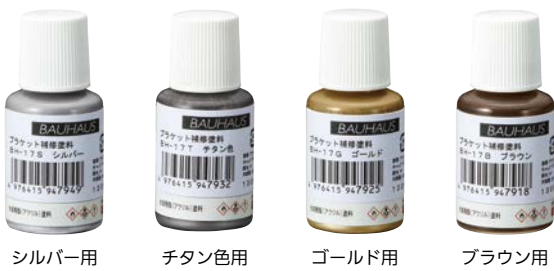
シルバー用 チタン色用 ゴールド用 ブラウン用