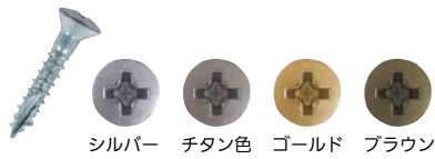
シルバー チタン色 ゴールド ブラウン