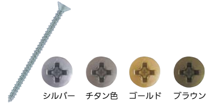
シルバー チタン色 ゴールド ブラウン