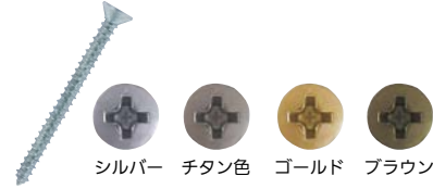
シルバー チタン色 ゴールド ブラウン