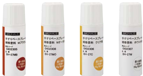
Mブラウン用 Mオーク用 クリア用 ホワイト用